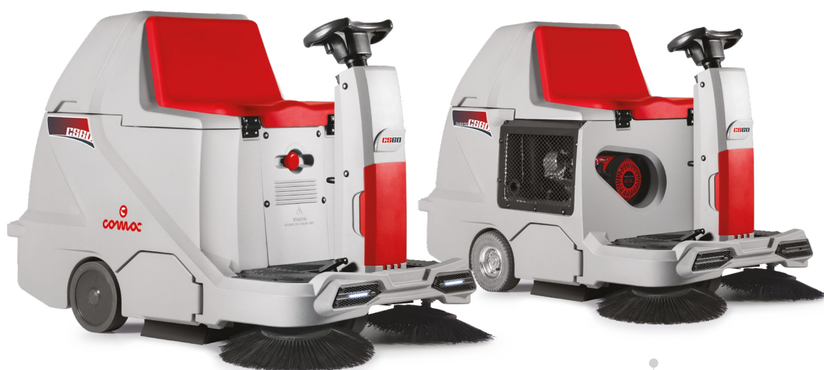
CS60 B Versione a batteria